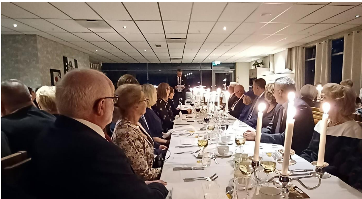
Den avslutande banketten på höstfesten avhölls i Skybar på Hotell Hallstaberget.

Resultatet blev långt över förväntan, inte bara inbitna Västernorrmlänningar med ett förflutet vid regementet utan även många andra, med känsla för I 21 strömmade, till och deltog i aktiviteterna. Lite längre ned i Information december 2021 finns en länk till 14 bilder från höstfestens båda dagar.