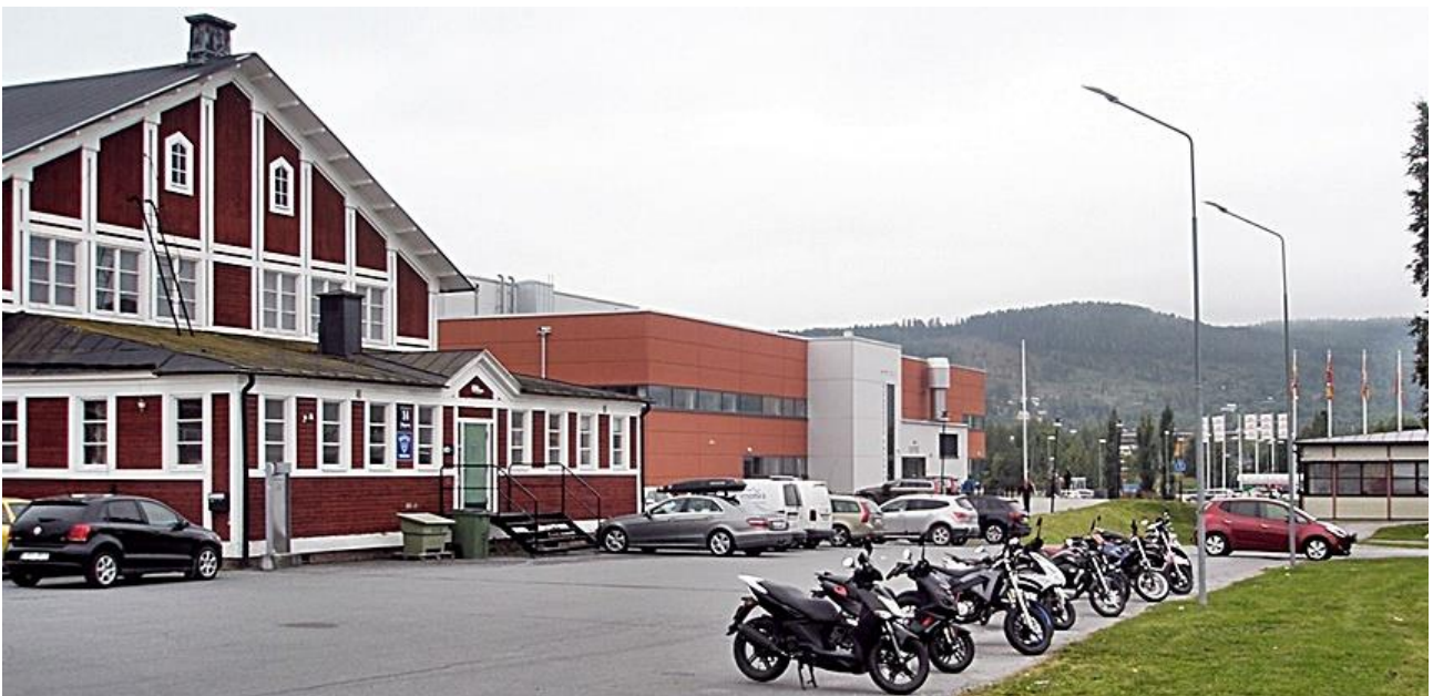
Ett i dag livligt hörn av I 21 f d kaserngård. I huset t v som var I 21 gymnastiksal tränas det fortfarande flitigt. Bortom gymnastikhuset syns badhuset Aquarena med gym och fitness. I huset som skymtar till höger, där regementets matsal var inrymd, huserar nu lågprisbutiken Mycket Mera för pengarna. I bakgrunden ses ICA Kvantums flaggor. Notera, vid kanten av gräsmattan, gymnasieelevernas snyggt inrättade tvåhjulningar.