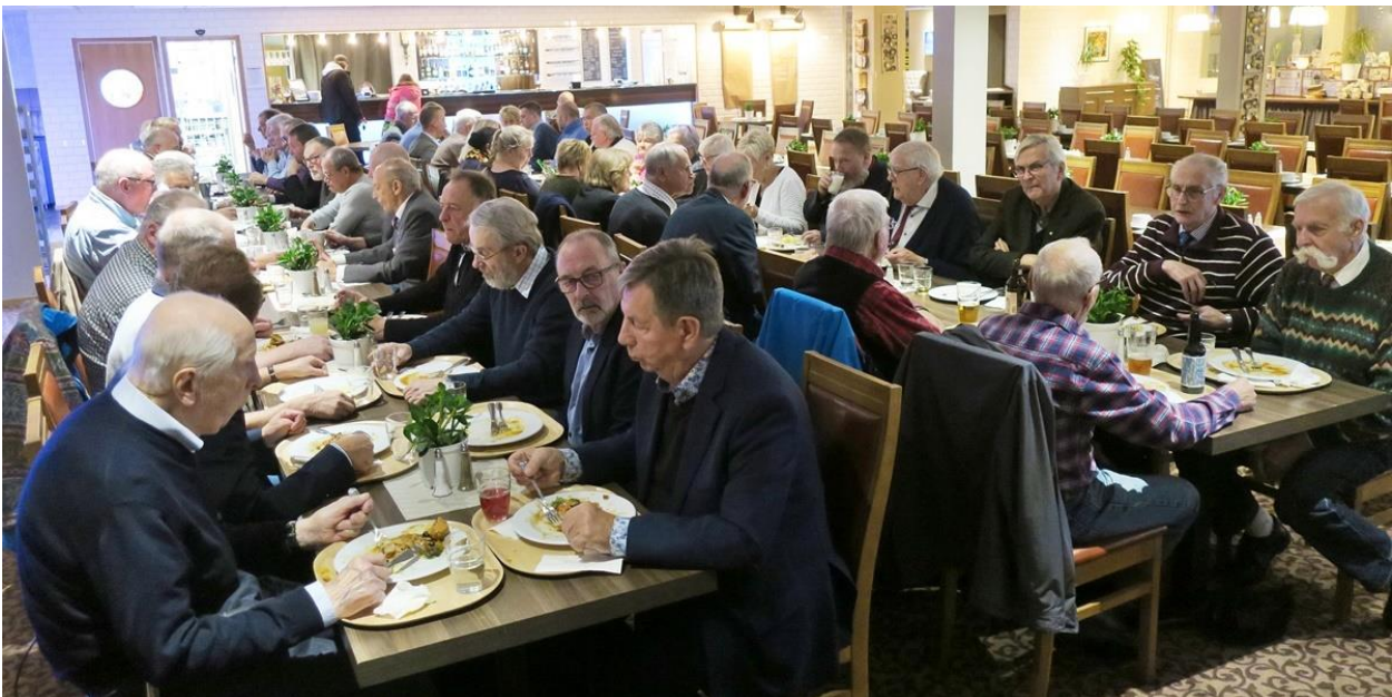
Middagen intogs i hotellets stora matsal där det hade dukats upp en välsmakande buffé.