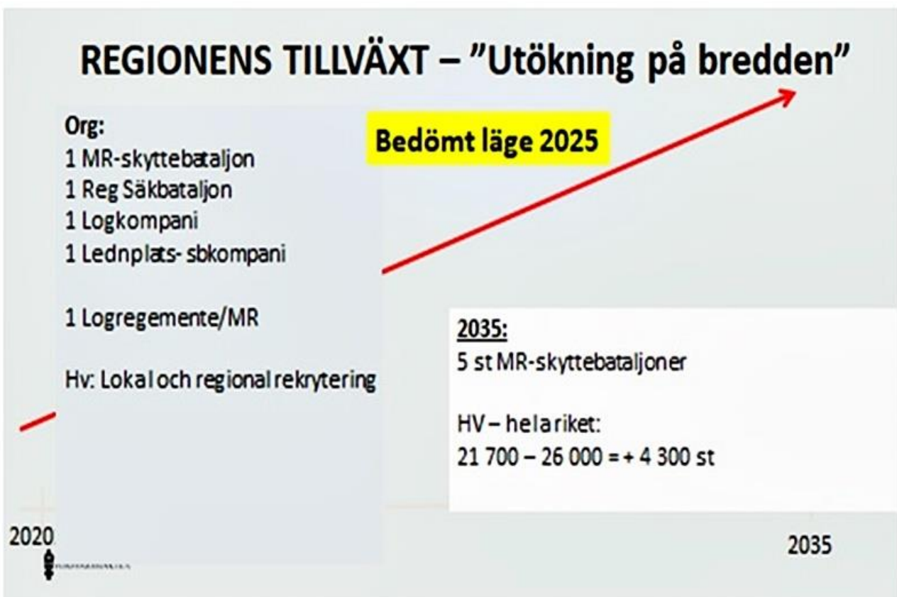
Bilden visar bedömd tillväxt av Norra militärregionen under perioden 2020-2025.