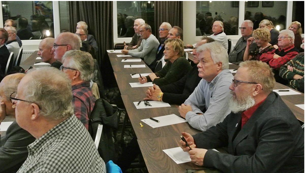
Bland åhörarna fanns många andäktigt lyssnande Västernorränningar, Norrlandsträngare, representanter för frivilligrörelserna och försvarsvänner.