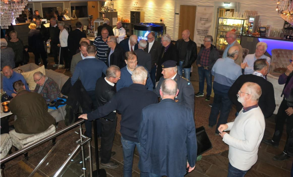
Samlingen ägde rum i Hotell Hallstabergets foajé.