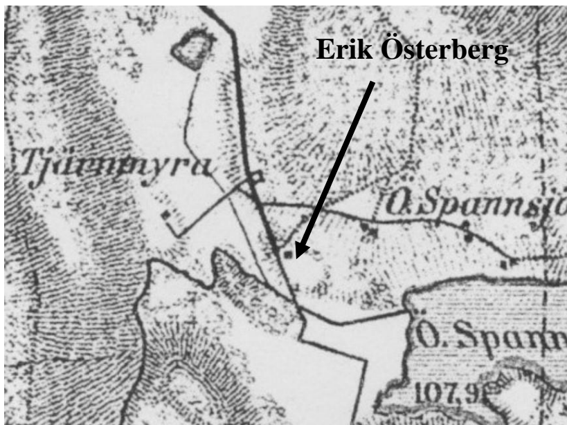
Karta från 1900