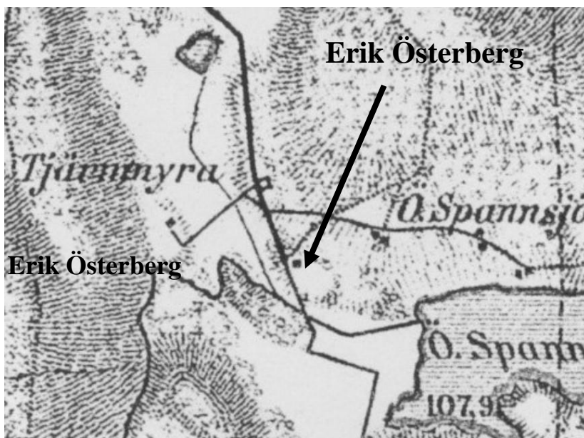
Karta från 1900